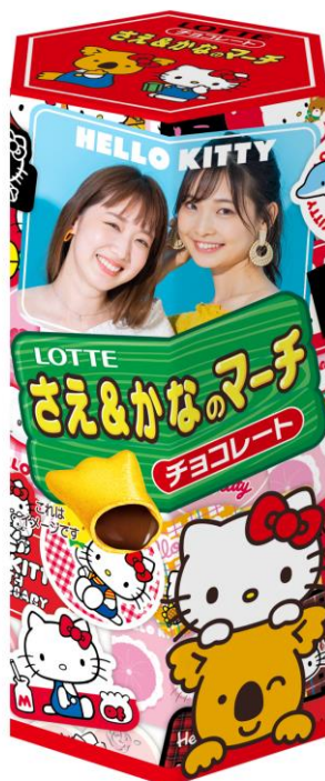
◆「ハローキティ ～キティと旅する未来～」 デザイン