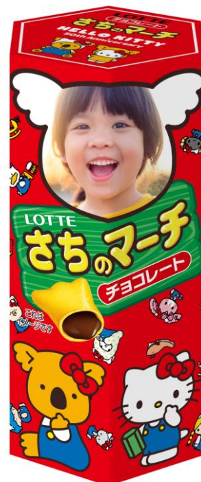
◆「ハローキティ ～パーティータイム～」 デザイン

※上記人物の画像・名前はサンプルです。実際の商品にはお客様指定の画像と名前が入ります。